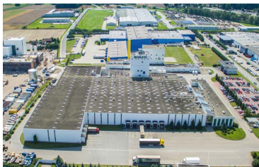
Zakład produkcyjny w Żorach