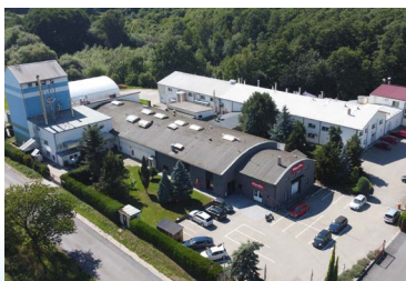
Zakład produkcyjny w Voticach