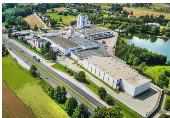
Zakład produkcyjny w Ustroniu